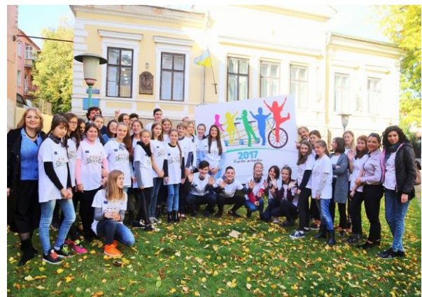
"Колір кордону!", Сучава