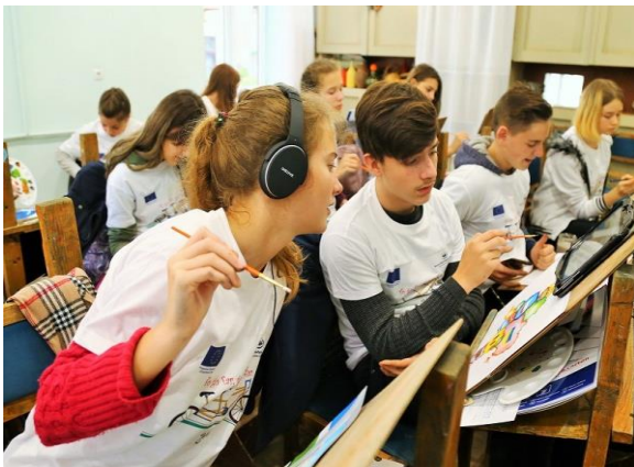
"Колір кордону!", Чернівці

Більш детальна інформація та фотографії з кампанії ECDay, в якій брали участь 74 міст з Європейського Союзу та сусідніх країн, доступні на офіційному веб-сайті: https://www.ecday.eu/