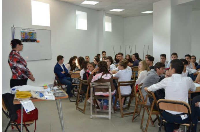
Семінар: "Політика ЄС щодо охорони довкілля, в транскордонному контексті", Сучава, Румунія