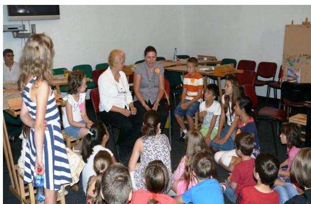
Молодіжний регіональний форум “ Молодь Яловени просуває європейські цінності ”, Яловени , Республіка Молдова