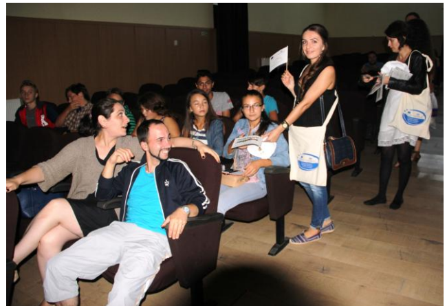
Інтереси дітей не мають кордонів, Сучава, Румунія